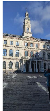
Abb.4: Rigas City Hall