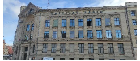
Abb.6: lettische Radiostation